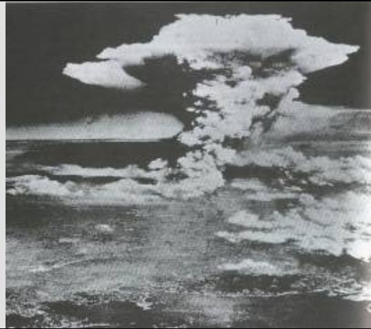
“Hau da gure oihua, hau gure eskaria: bakea munduan”

Hiroshimako bonba atomikoaren biktima Sadako Sasakiren omenez (1943-1955) eraikitako estatuan dagoen inskripzioa, Hiroshimako Bakearen Parkean.