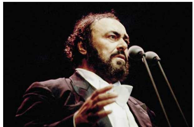
Luciano en uno de sus conciertos