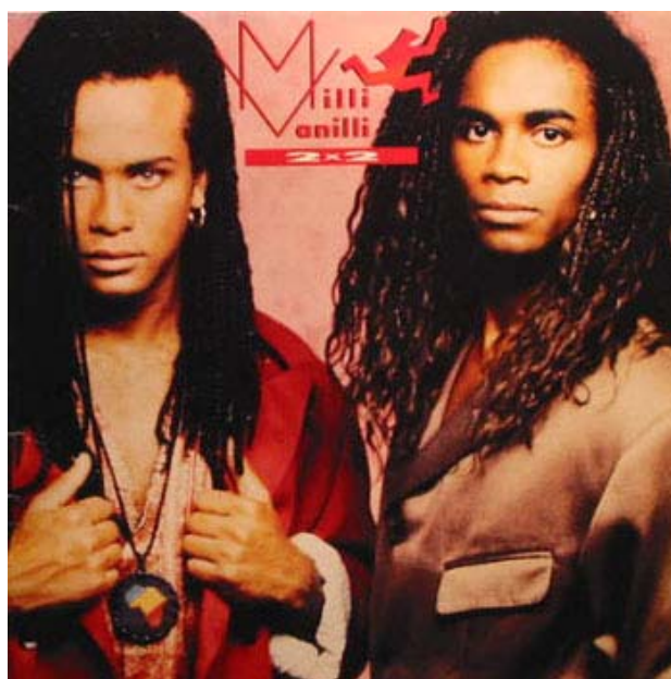
Portada del disco de Milli Vanilli

Robert Pilatus y Fabrice Morvan eran auténticos desconocidos hasta que se unieron y formaron el famoso dúo Milli Vanilli, con el que tuvieron verdadero éxito a finales de los años 80 y con el que consiguieron 2 Grammy's. Pero a principios de los años 90, mientras estaban dando un concierto, falló el “playback” y el público empezó a sospechar de la veracidad de sus voces. Allí empezó el declive de sus carreras, las que prometían ser las de unas estrellas, hasta que se destapó la verdad y dejaron de ser admirados y empezaron a ser odiados. Desde entonces ya no se sabe nada de ellos.