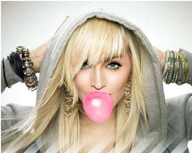
FOTO DE MADONNA DE SU NUEVA GIRA

Hay muchos cantantes que utilizan esta técnica en los conciertos porque realizan mucho esfuerzo en ellos, con bailes y distintos tipos de espectáculos, como en el caso de Madonna en su gira “ Girlie Show Tour ”, que tuvo que dejar de hacerlo por las quejas recibidas. Aunque en su última gira “ Blonde Ambition Tour ” sigue utilizando el “play back” en trozos de canciones para no realizar un sobreesfuerzo cantando y bailando.